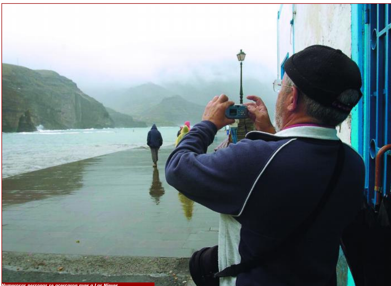
Numerosas personas se acercaron ayer a Las Nieves.