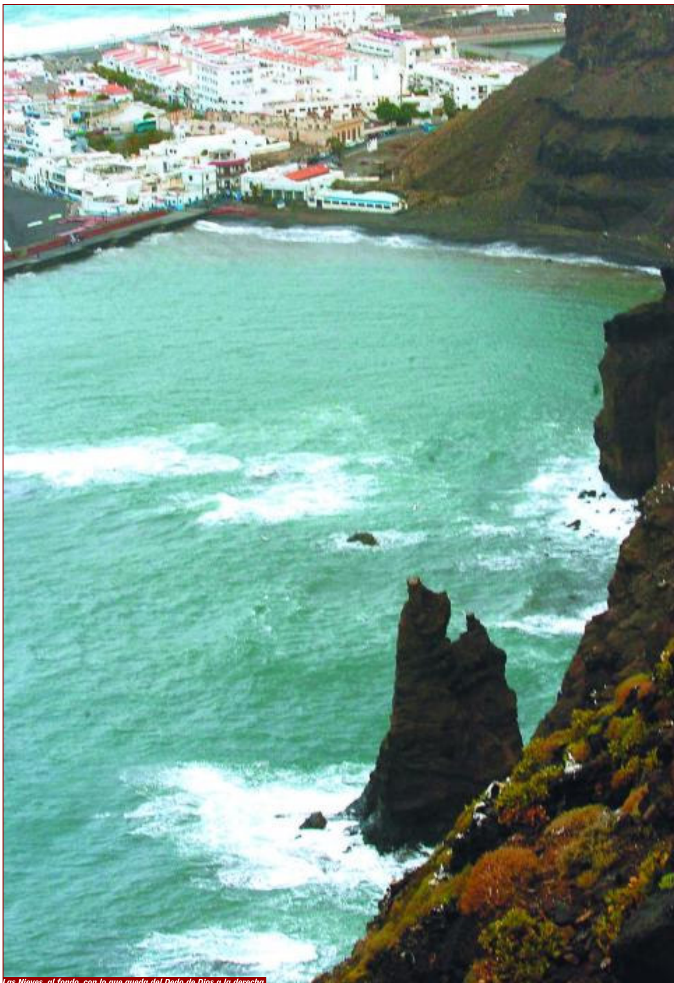
Las Nieves, al fondo, con lo que queda del Dedo de Dios a la derecha.