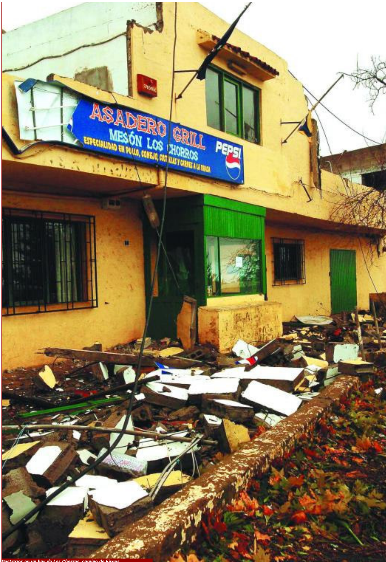
Destrozos en un bar de Los Chorros, camino de Fargas.