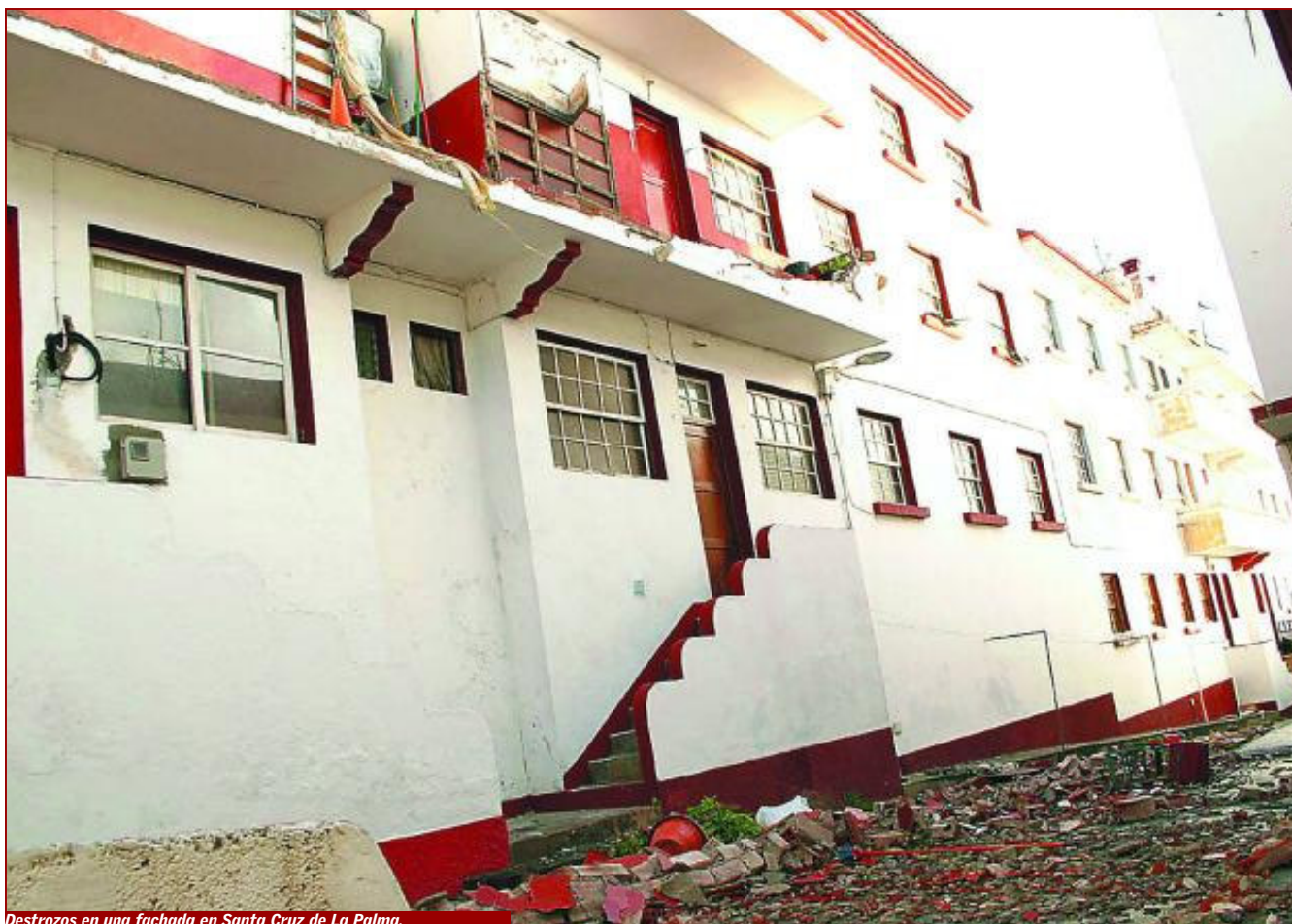
Destrozos en una fachada en Santa Cruz de La Palma.