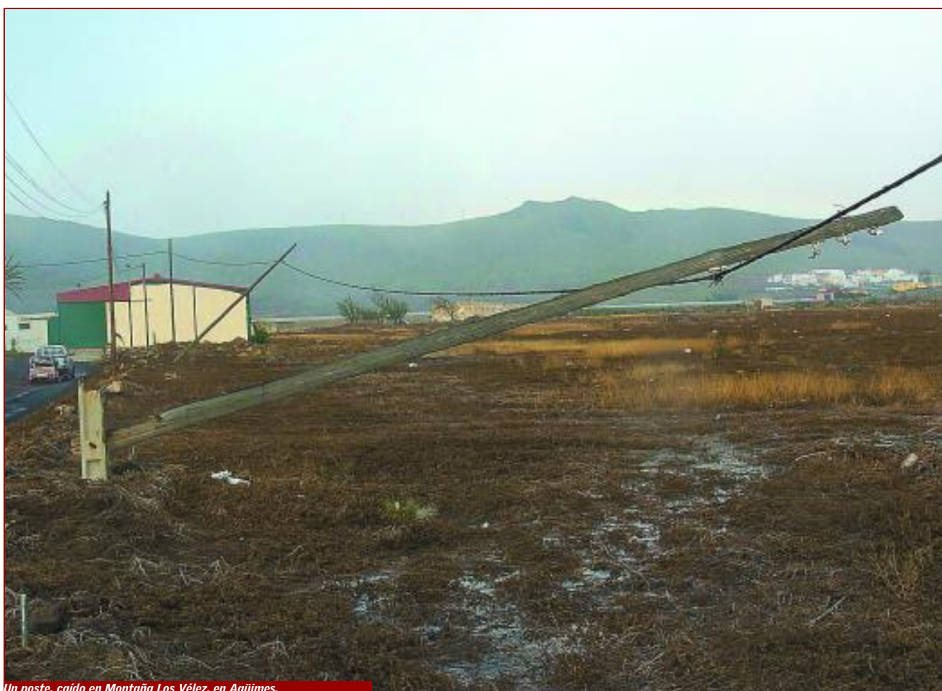
Un poste, caído en Montaña Los Vélez, en Agüimes.