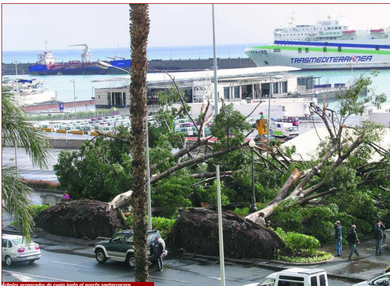
Árboles arrancados de cuajo junto al puerto santacrucero.