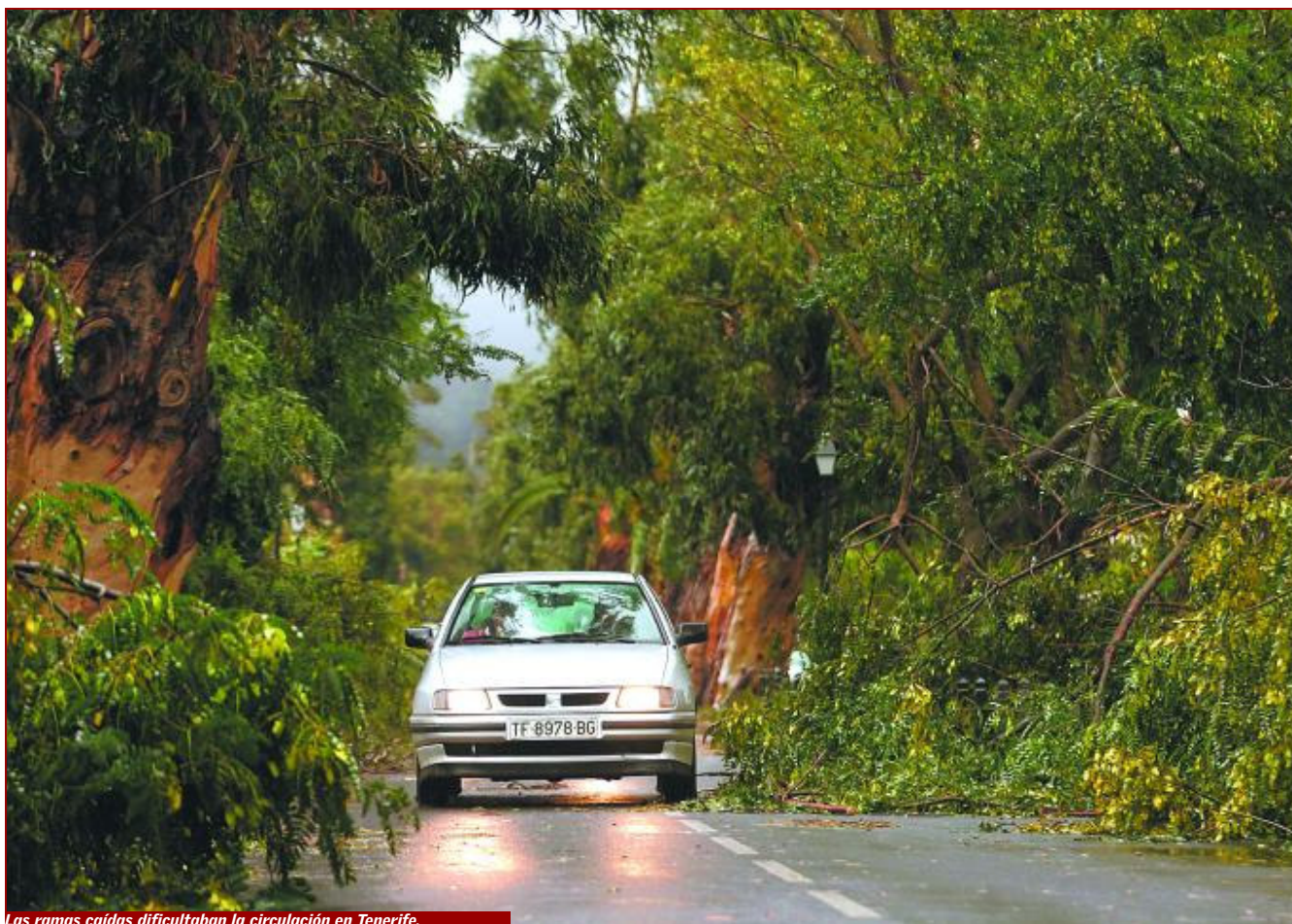
Las ramas caídas dificultaban la circulación en Tenerife.