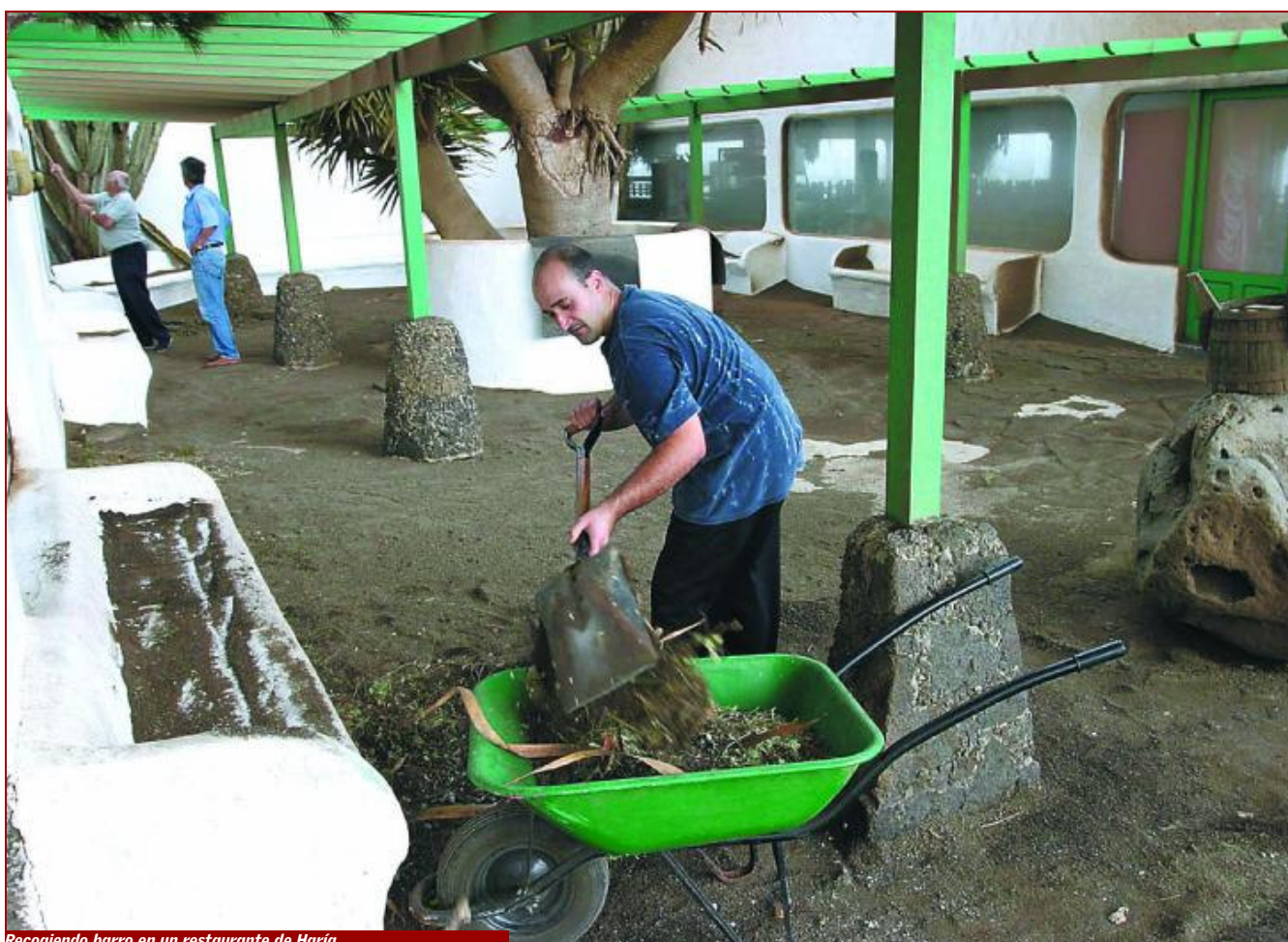
Recogiendo barro en un restaurante de Haría.