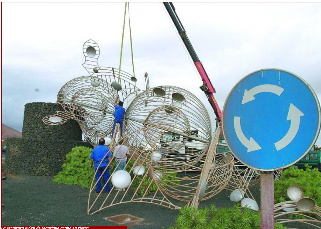
La escultura móvil de Manrique acabó en tierra.