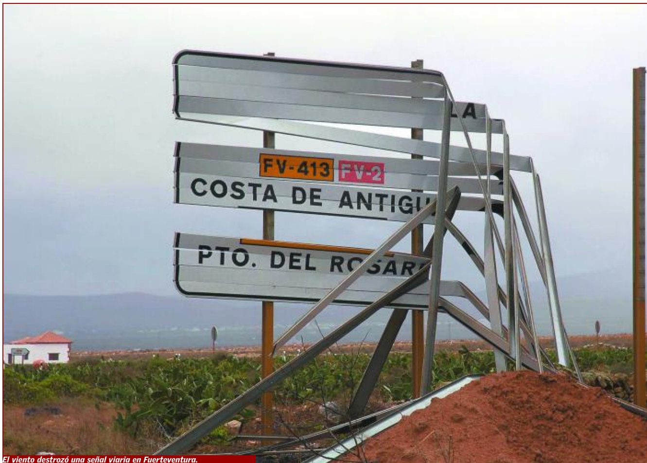
El viento destruyó una señal viaria en Fuerteventura.