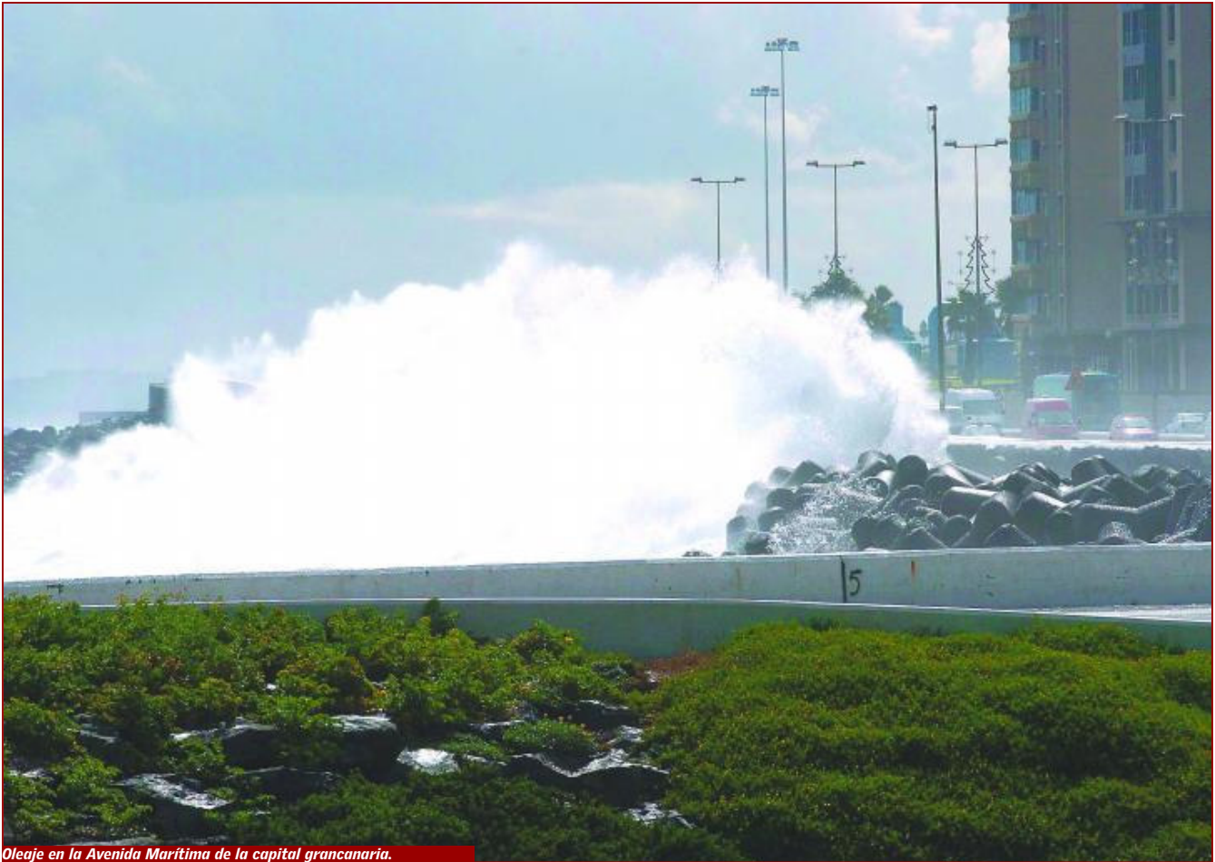
Oleaje en la Avenida Marítima de la capital grancanaria.