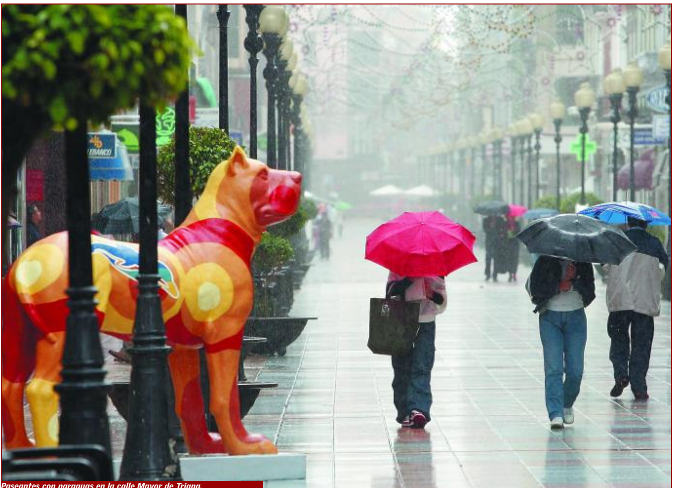
Paseantes con paraguas en la calle Mayor de Triana.