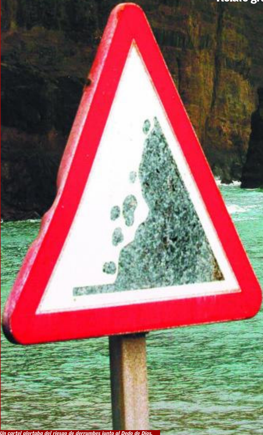
Un cartel alertaba del riesgo de derrumbes junto al Dedo de Dios.