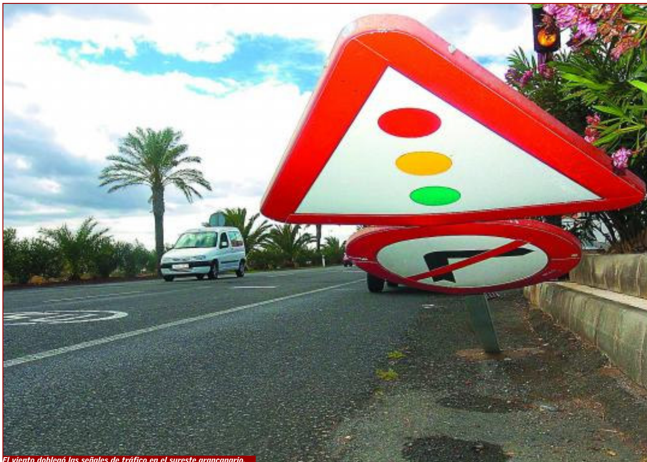
El viento dobló las señales de tráfico en el sureste grancanario.