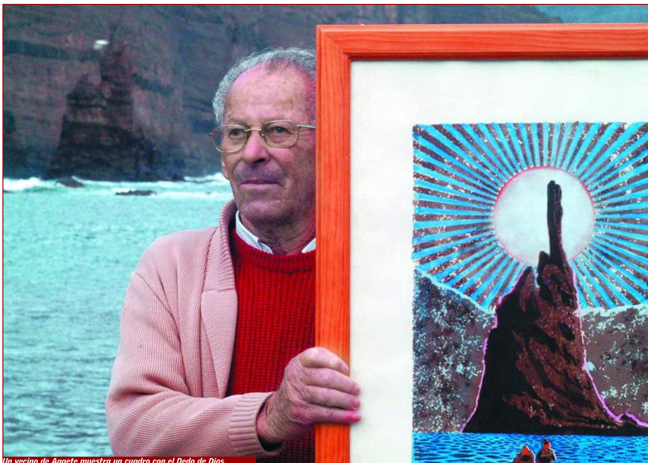
Un vecino de Agaete muestra un cuadro con el Dedo de Dios.