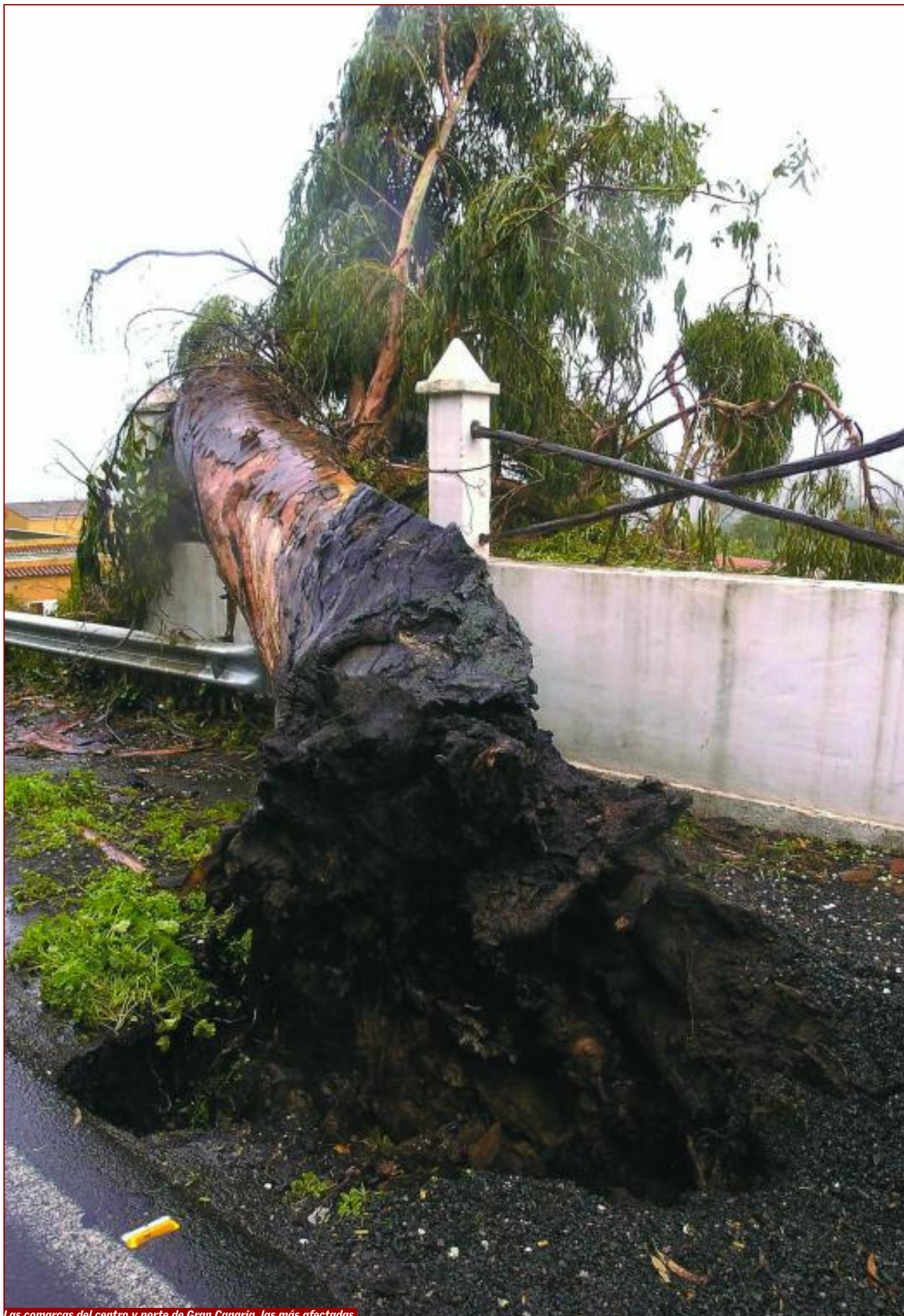
Las comarcas del centro y norte de Gran Canaria, las más afectadas.