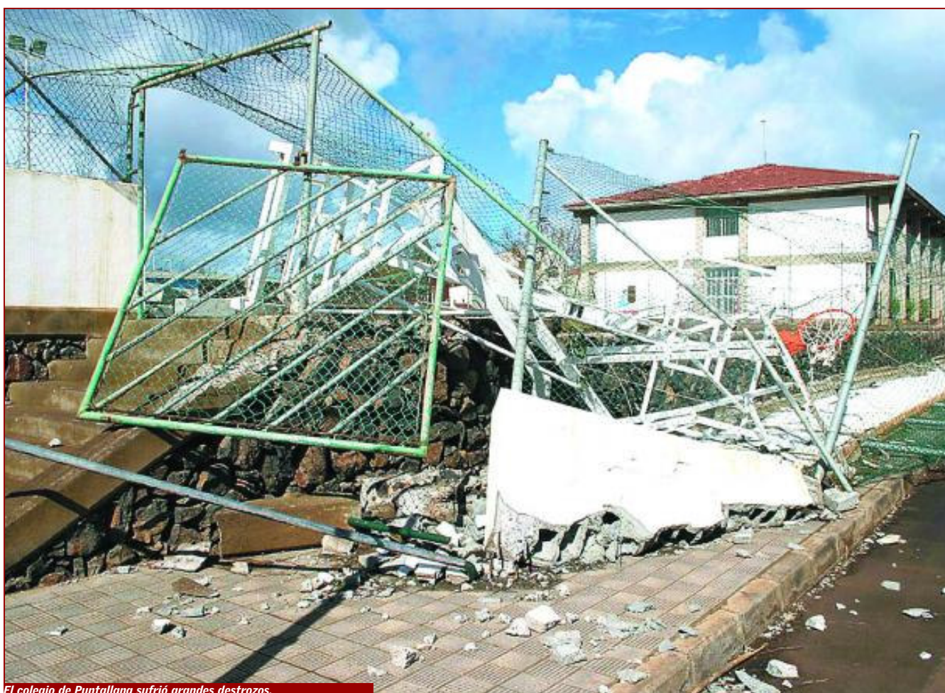
El colegio de Puntallana sufrió grandes destrozos.