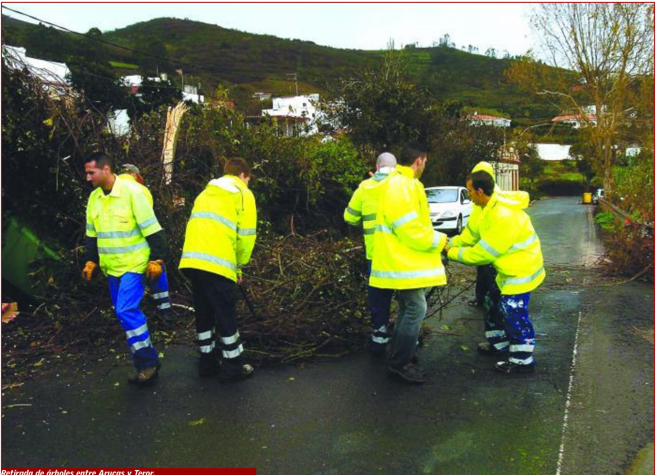
Retirada de árboles entre Arucas y Teror.