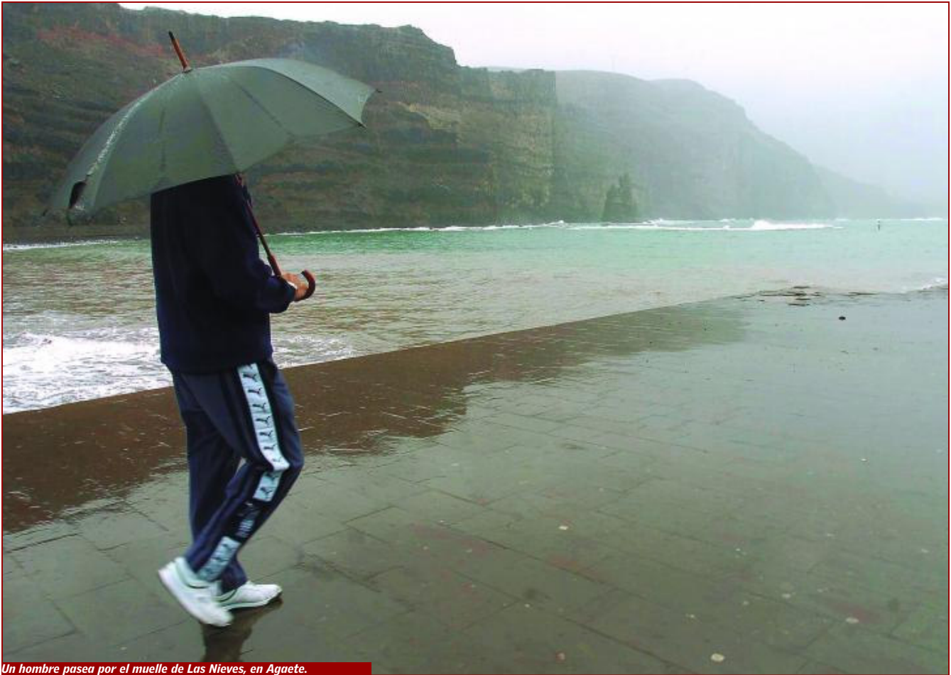
Un hombre pasea por el muelle de Las Nieves, en Agate.