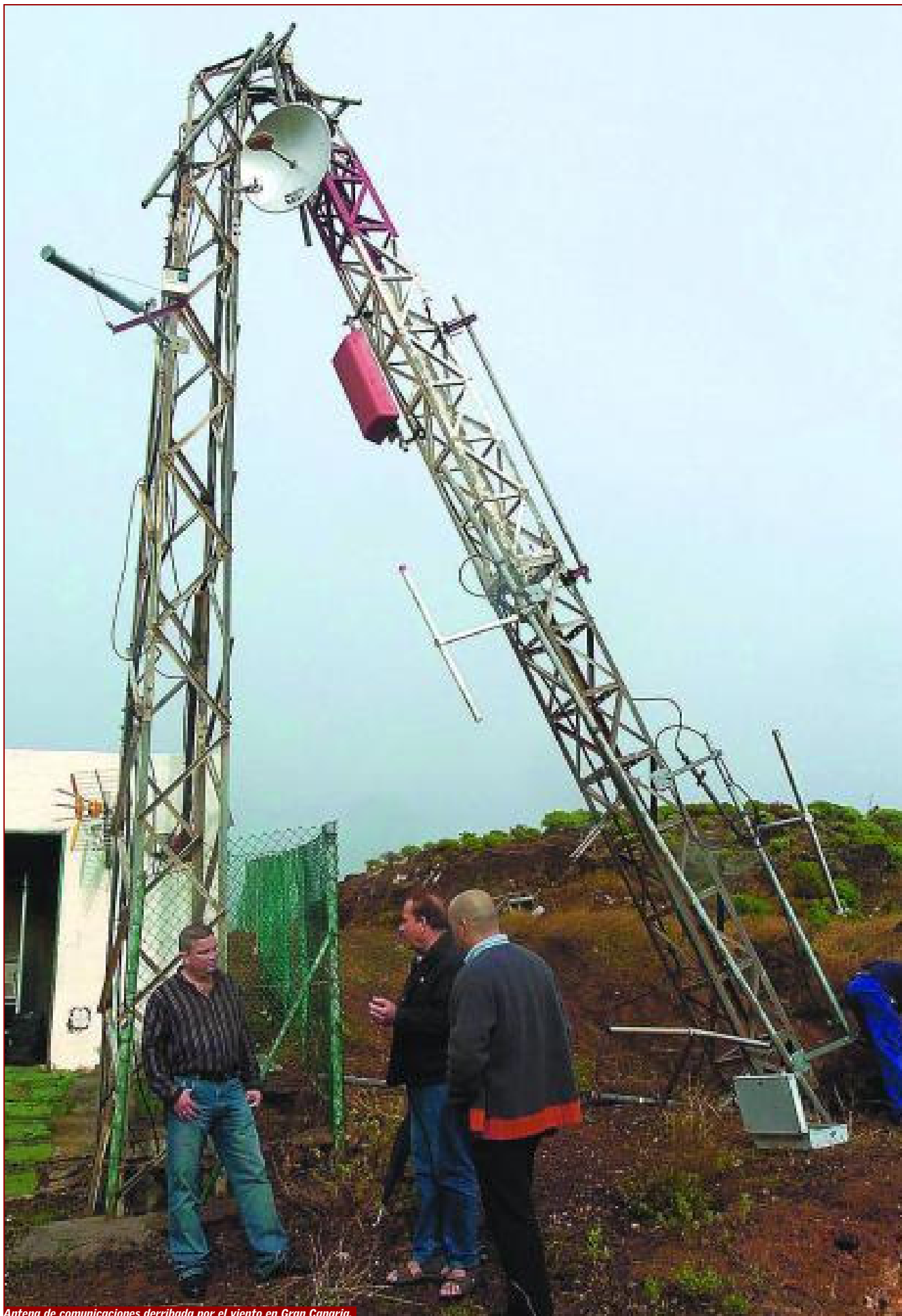
Antena de comunicaciones derribada por el viento en Gran Canaria.