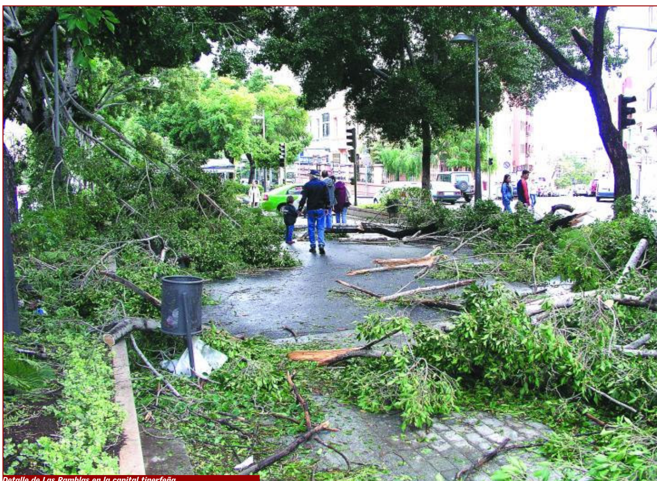
Detalle de Las Ramblas en la capital tinerfeña.