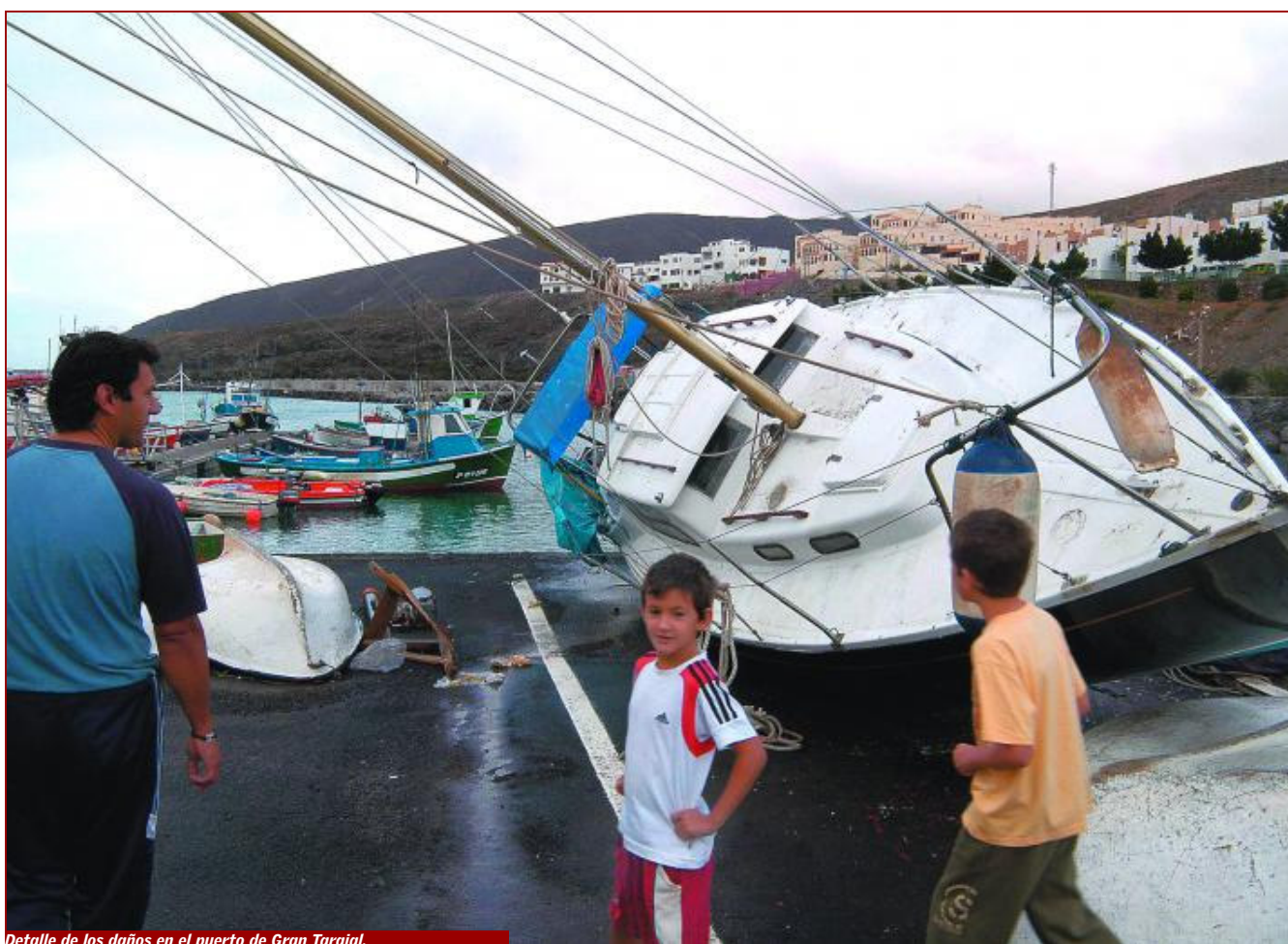
Detalle de los daños en el puerto de Gran Tarajal.